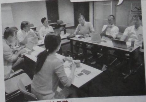
日本レーザー「社長塾」

7月下旬の社長塾。約60人の社員が数グループに分かれ、3か月交代で参加する。英語力強化に力を注ぐ同社では、大半の社員が参加しているという